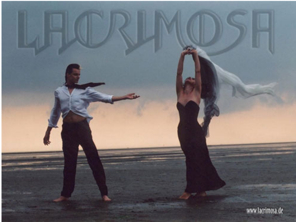
Интервю с Tilo Wolff от Lacrimosa